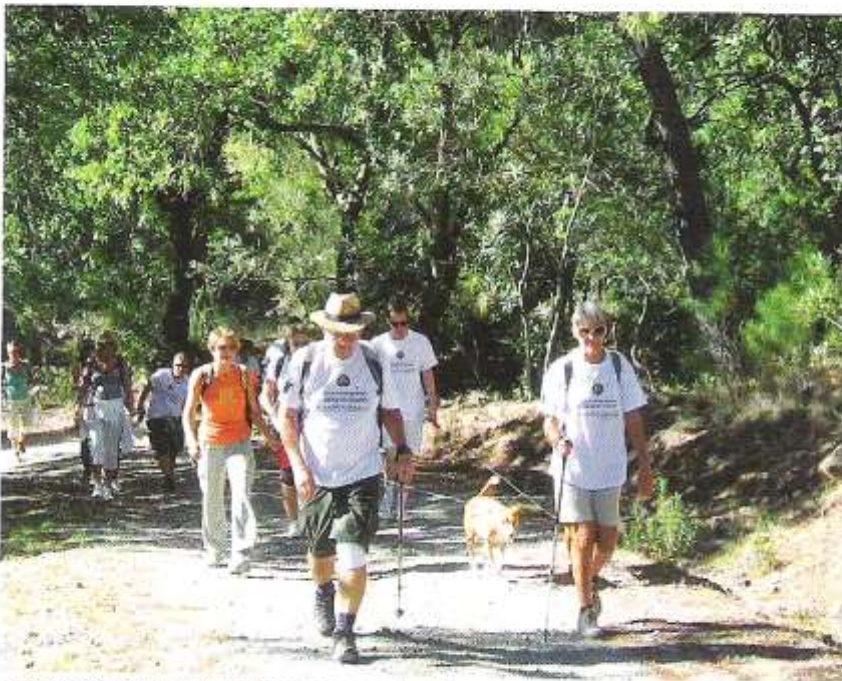
5,500 euros were collected at the »sponsored walk«

Atmosphäre diskutiert. Als wichtigste Zielsetzung gilt die lokale, nationale und internationale Wohltätigkeit und die Beschaffung von Geld für wohltätige Zwecke: Unter anderem zur Unterstützung von Freiwilligen-Hilfsorganisationen, die zum Beispiel Kinder oder Menschen in Not mit Geld, Lebensmitteln und Bekleidung versorgen. Auch werden Dinge für diese Organisationen gekauft, die sie dringend benötigen, wie zum Beispiel Kühlschränke, PCs, Büromaterial, einen Pizza-Ofen, ein Fahrzeug, um warme Mahlzeiten auszufahren, oder einen Wassertank für ein Waisenhaus in Uganda. Unterstützt werden Organisationen wie die Caritas von Marbella und San Pedro, SER Humano, Demeter, Horizonte und Cudeca. Für DYA, Marbella konnte bereits ein Notfallkrankswagen gestiftet werden und es wurde Geld für die Berufsausbildung von Mädchen in Sri Lanka geschickt, damit diese leichter einen Job finden können.